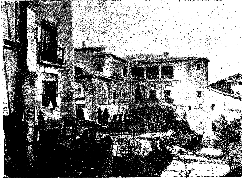
VITORIA.—PALACIO DE BENDAÑA

Vitoria es una de las ciudades que más interés ofrece á los arqueólogos. La casa del Cordón, residencia incidental del famoso cardenal Adriano; el palacio de Cincunegui; la casa de los Alavas; el palacio de Monte-hermoso y otras muchas antiquísimas construcciones, son otras tantas manifestaciones del gusto arquitectónico que imperó siempre en la hermosa ciudad de los alaveses.