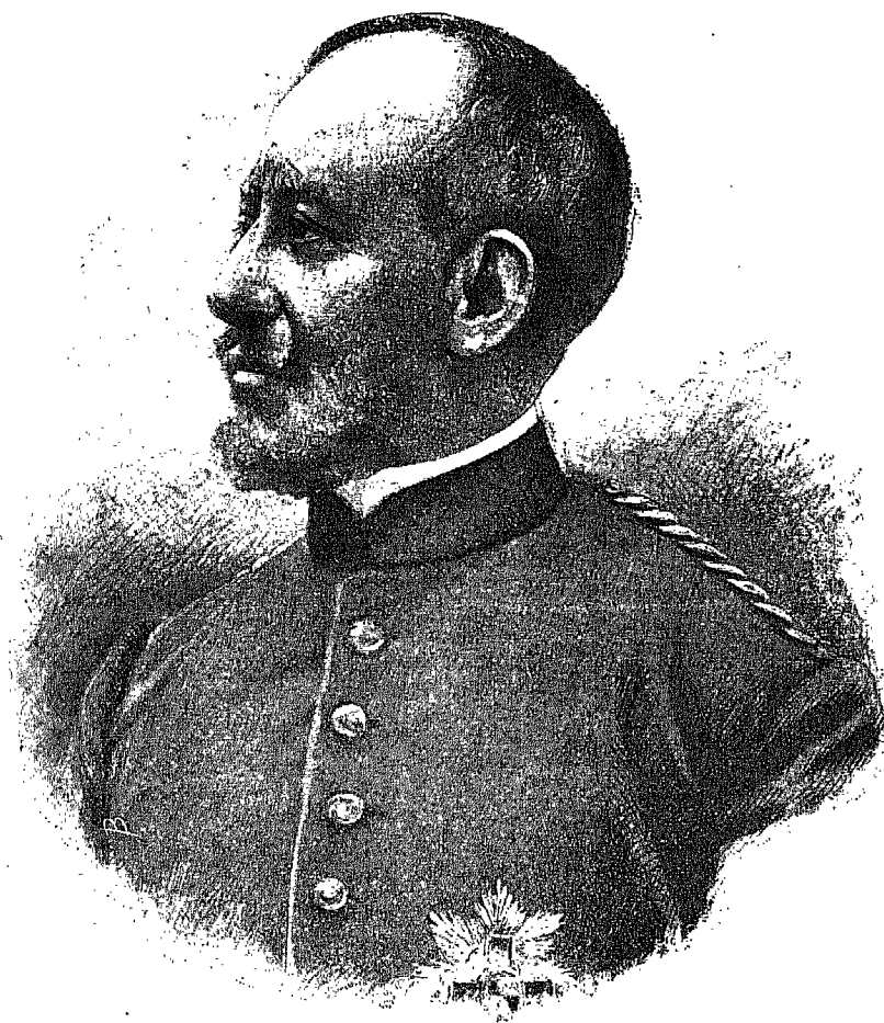
GENERAL JOSÉ GARCÍA Y NAVARRO