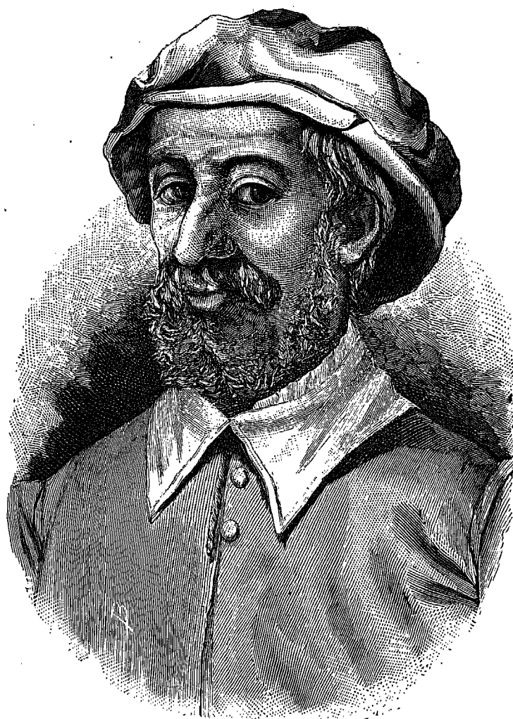
JUAN DE ICIAR (Autor de la primera Ortografía Española)