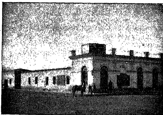
Taller mecánico de Pellegrini y Durrels y Talabartería de Sotero Beamurguía

El café Laurak-Bat está situado en un lindo paraje, frente á la plaza y contiguo al Club.