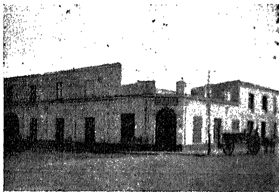
Almacén de Ipiña y Elescano

Chascomús se fundó á mediados del siglo pasado. El capitán Betbezé obtuvo permiso en 1777, para trasladar la población (origen de la ciudad de Chascomús) que existía en el punto llamado «El Zanjón», situado en la margen derecha del río Samborombon, á orillas de la laguna Chascomús, donde hoy está situada la ciudad.