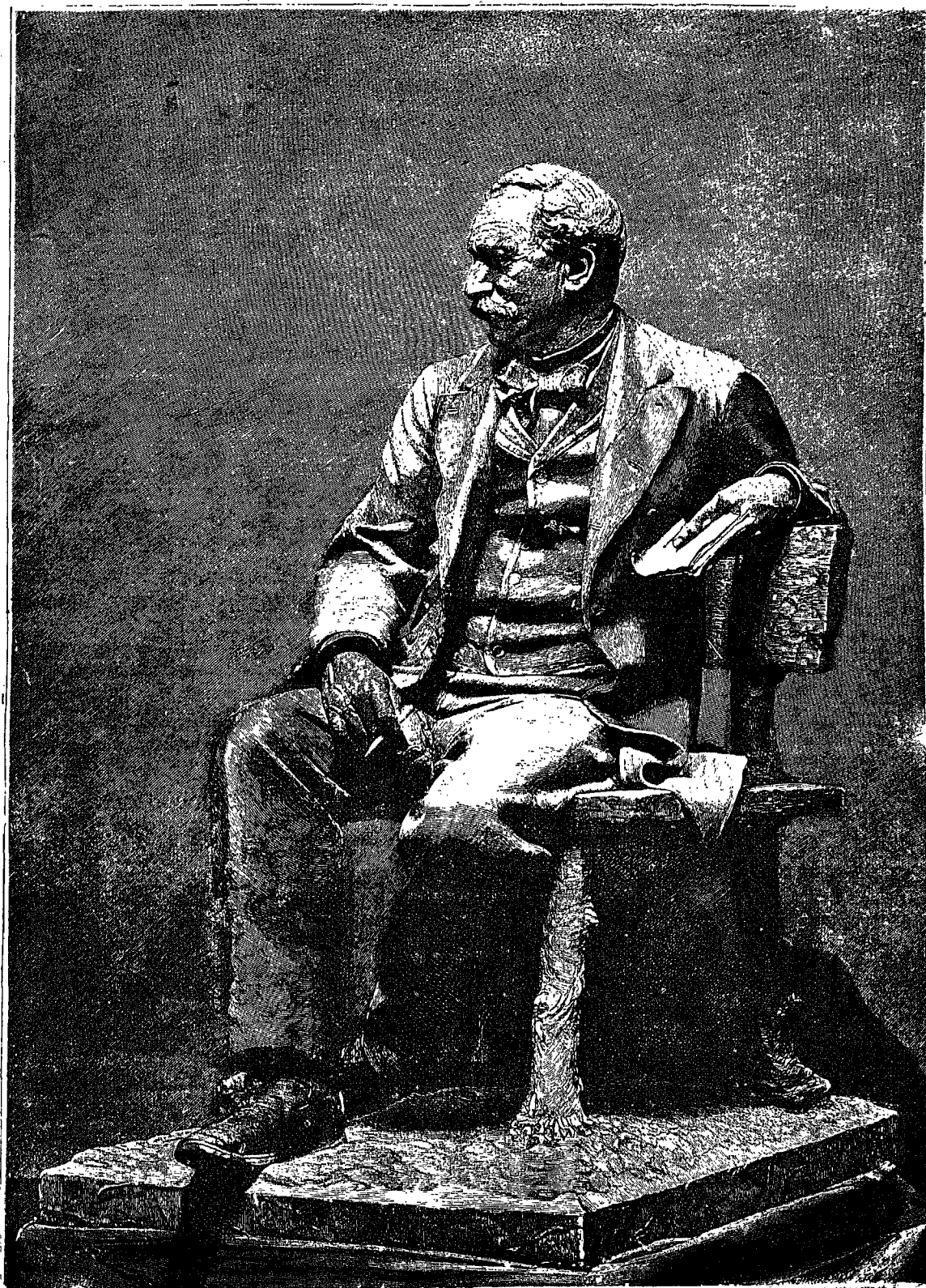
ESTÁTUA DE TRUEBA, por Benlliure

inaugurada el 10 de Noviembre de 1895 en Bilbao, en los jardines de Albia.