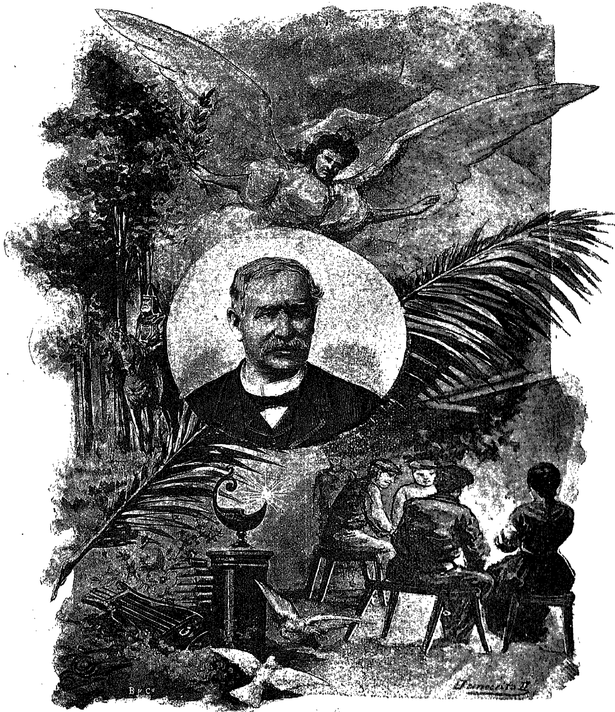
HOMENAJE Á TRUEBA