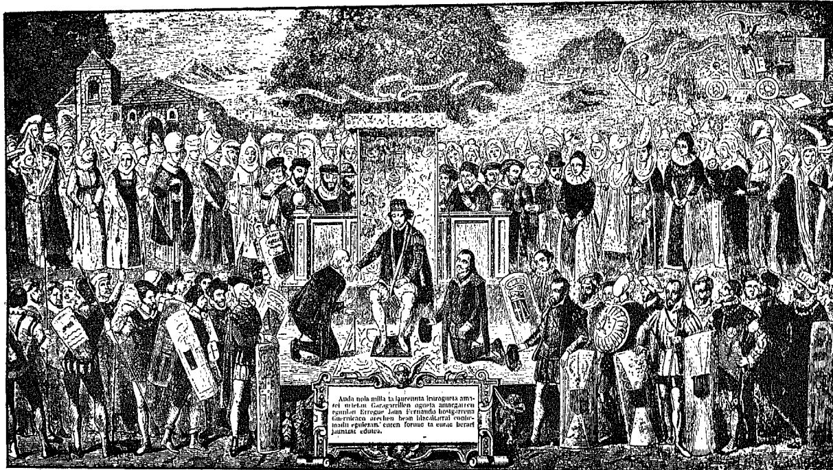
CUADRO DE LA JURA.