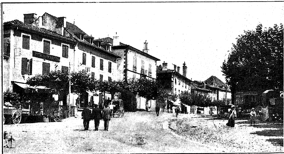
DONIBANE. — (San Juan Pie de Puerto). — Plaza del Mercado

Arrotz guztiak arriturik dauzkaten Euskalerrri'ko Eliz eder, zabal, galant oiek egiteko gure Amaren