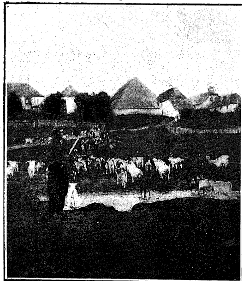
BURGUETE — (Nabarra) Vista parcial de la villa y un rebaño de cabras

Aún estamos a tiempo para reparar este olvido.