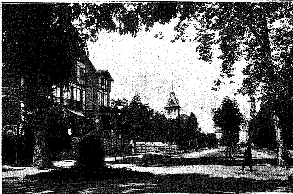
VITORIA.—Paseo del Prado