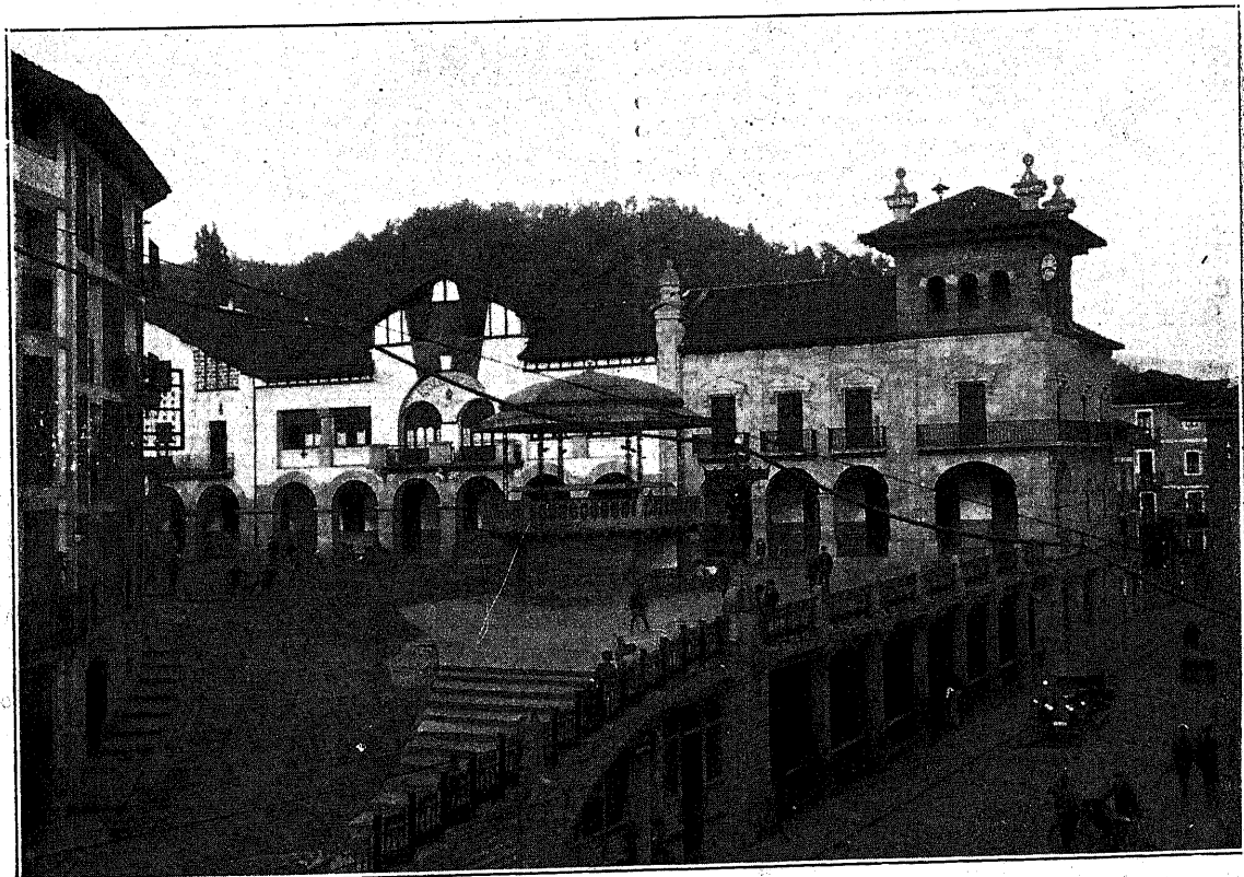
BEASAIN.—Nuevo edificio del Ayuntamiento

¡Qué orgullo el de una raza que da mujeres