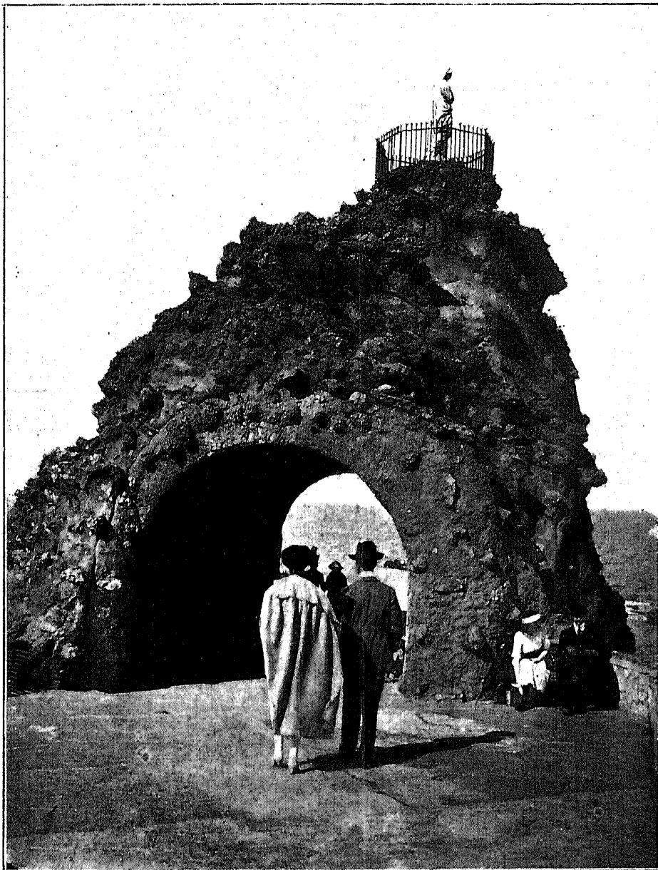
BIARRITZ — La Roca de la Virgen

Núm. 1286 Buenos Aires, Junio 20 de 1929