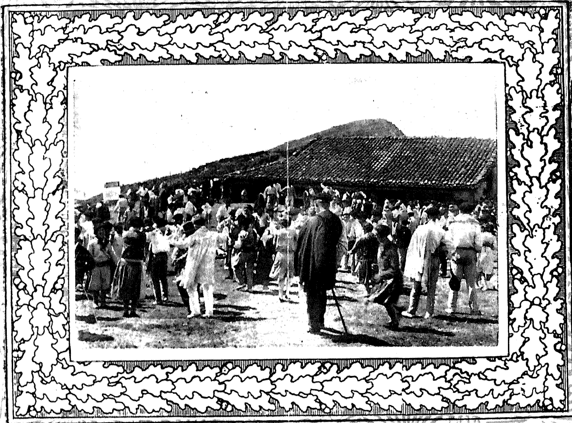
Festejando la entrada del Año nuevo

REVISTA DECENAL ILUSTRADA FUNDADA EN EL AÑO 1892