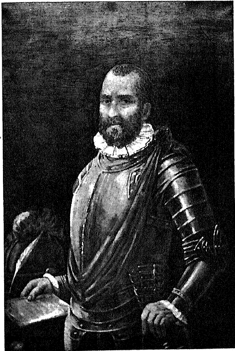
JUAN DE GARAY