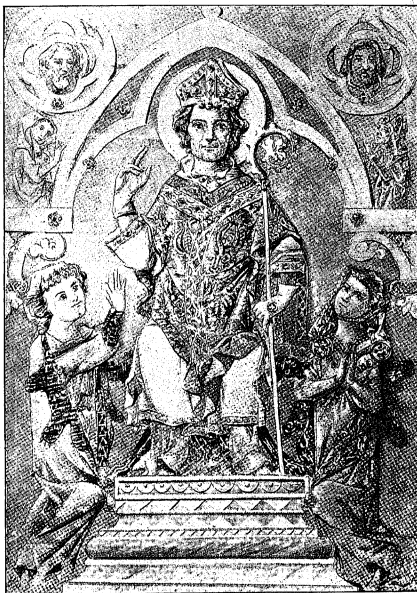
SAN FERMÍN, obispo PATRONO DE PAMPLONA.—7 DE JULIO