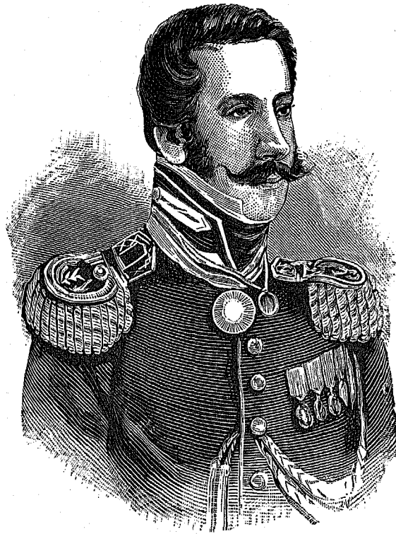
GENERAL D. FÉLIX DE OLAZABAL