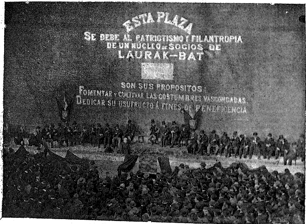
ASAMBLEA MAGNA CELEBRADA EN LA "PLAZA EUSKARA" EL 8 DE MAYO DE 1898.