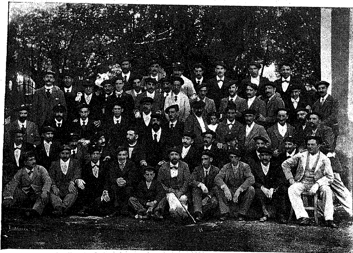
GRUPO SACADO EN LAS FIESTAS EUSKARAS CELEBRADAS EN VILLARO