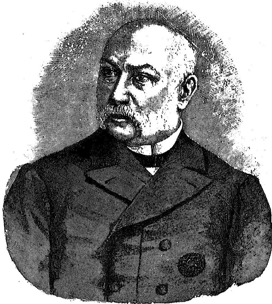
ESTANISLAO DE URQUIJO Y LANDALUCE