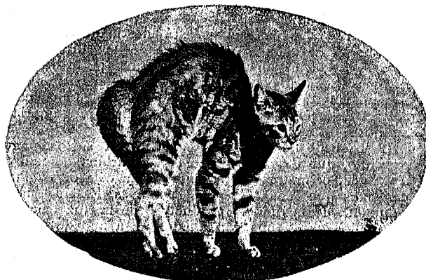
4—Es el Bull-terry del niño! ¡Miu!.... ¡Miu!.... ¡Pite peligral!.... ¡Huyamos!