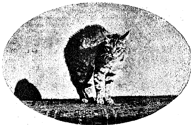
3—Pongámonos en actitud sentimental. ¿Le pediré un beso?