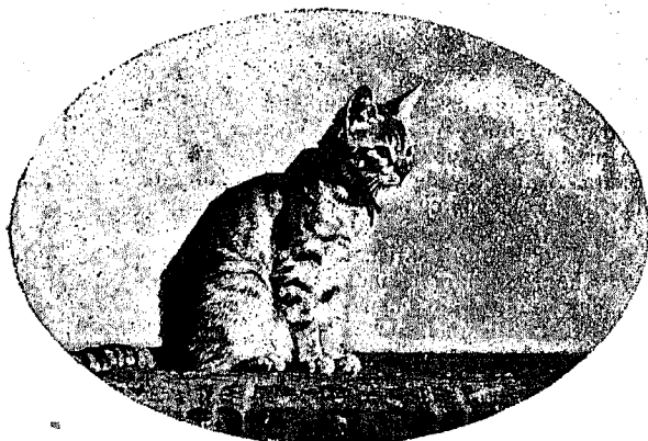
1—¿Vendrá Pite? ¡Cuánto le amo!....