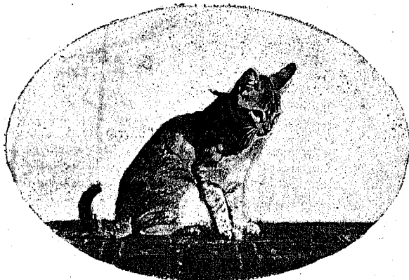
2—¡Es ella!.... veo asomar una cabeza en la gatera.