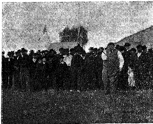
EL JUEGO DE LA «BARRA»

En la principal dependencia está la desnatadora "Alexandra," cuyo cilindro centrífugo dá algo más de 6500 vueltas por minuto. En la parte superior hay un depósito medidor en el que se vierte la le-