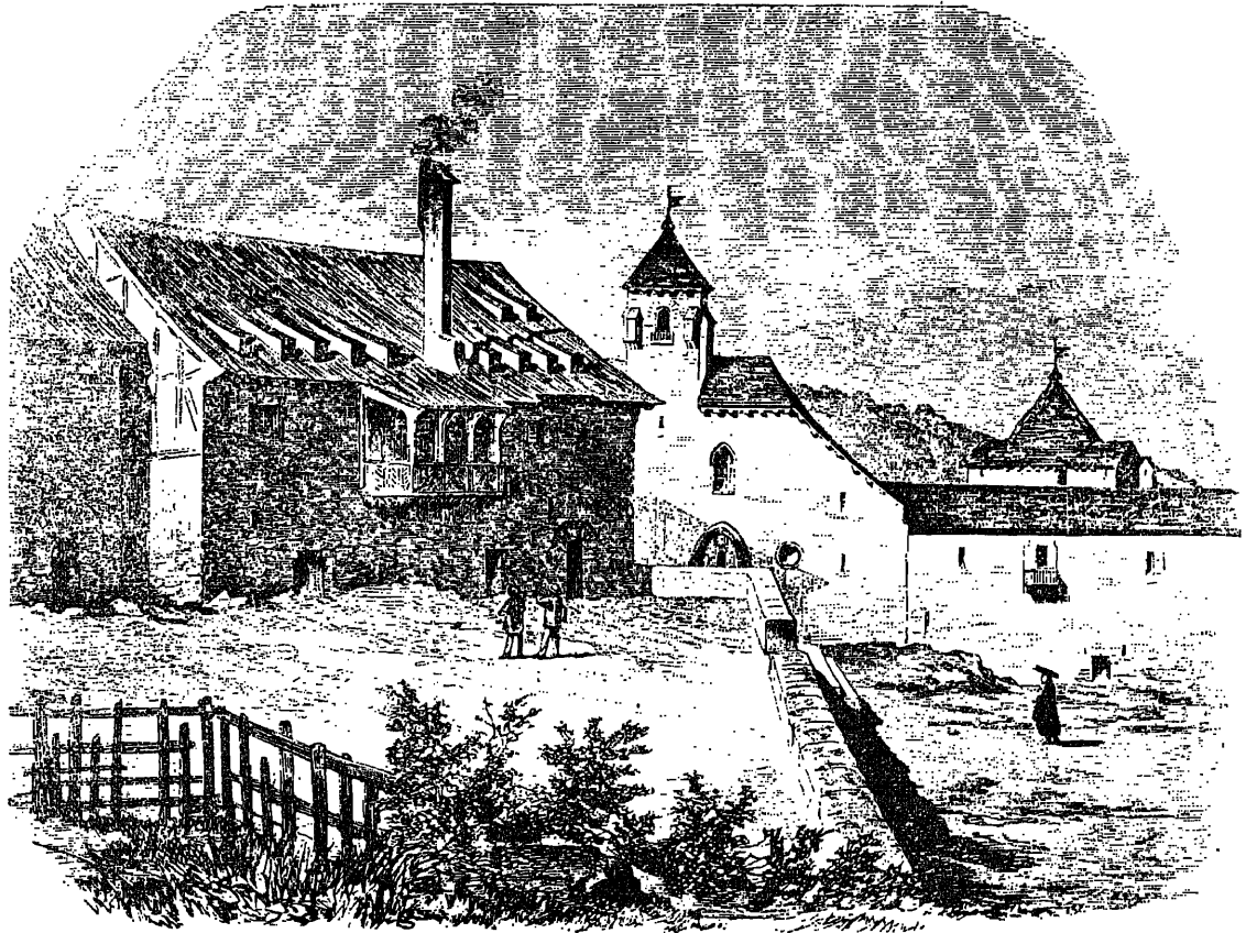
COLEGIATA DE NTRA. SRA. DE RONCESVALLES