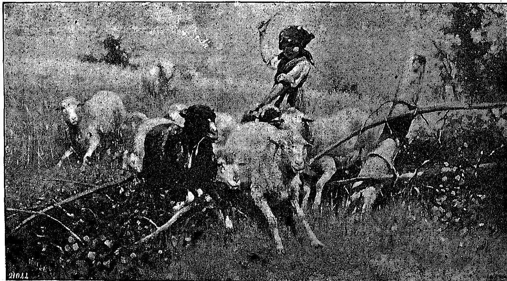
GURE MENDIETAKO GERTAERA BAT