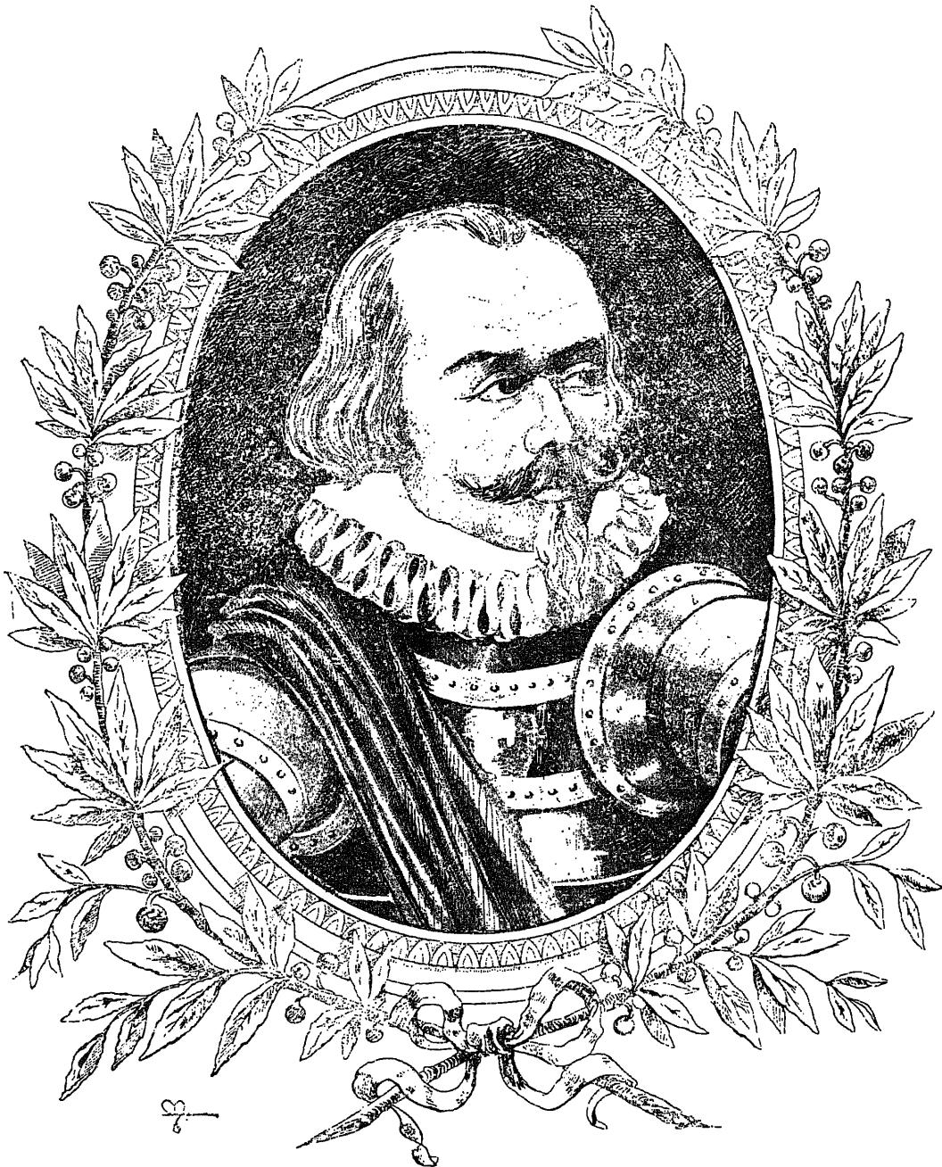
D. ANTONIO DE OQUENDO