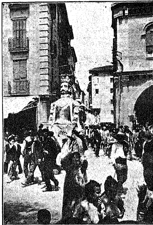
NÚMERO TÍPICO DE LAS ÚLTIMAS FIESTAS DE SAN FERMÍN, EN PAMPLONA.