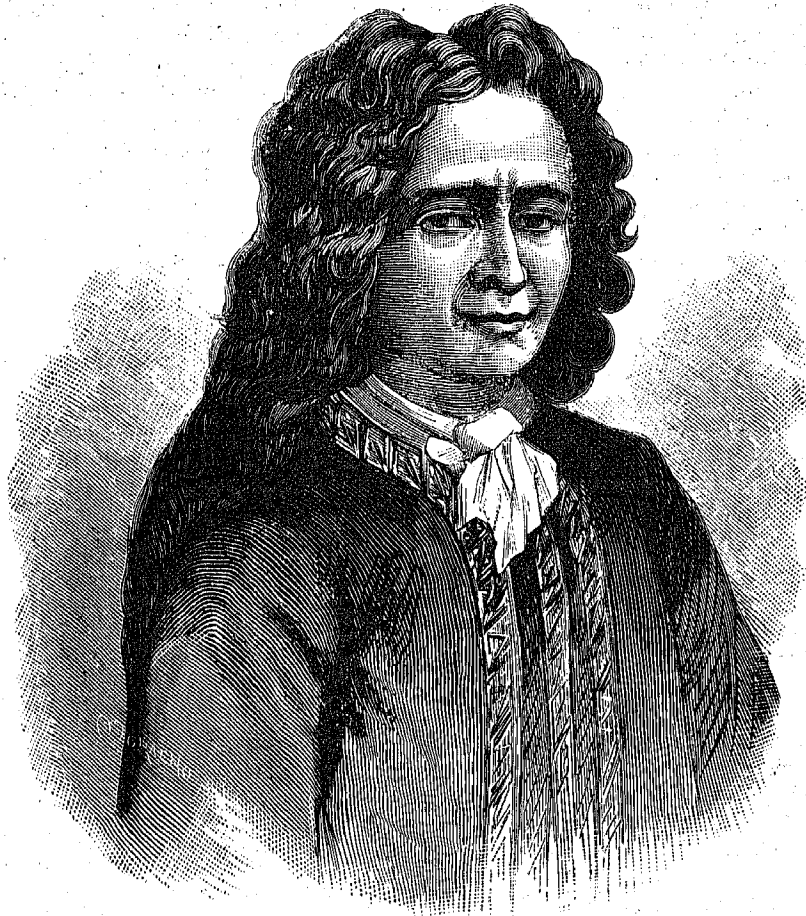
D. ANTONIO DE GAZTAÑETA