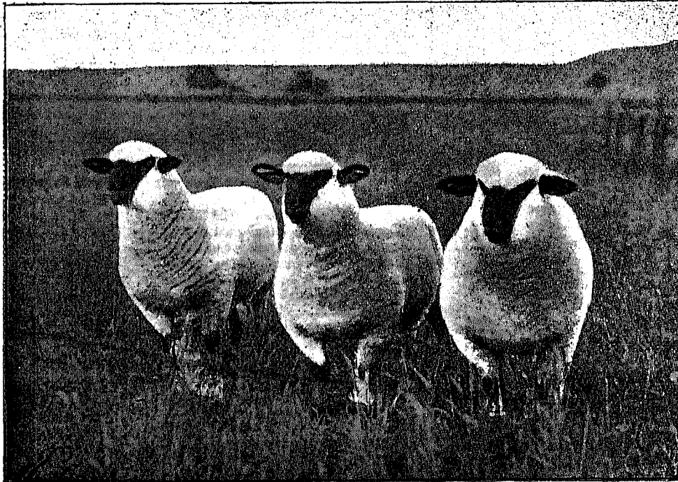
LA RAZA DEL PORVENIR—BORREGOS HAMPSHIRE

El frigorífico del Mercado de Abastos Proveedor será de una capacidad de 3.000 metros cúbicos; el primero de este género en Sud América.