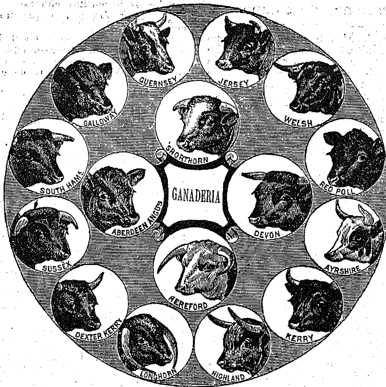
CABEZAS, REPRESENTANDO LAS RAZAS VACUNAS

El ministro de hacienda ha ordenado a la aduana de la capital, permita la libre introducción de los artículos que vengán con destino a la exposición de indus-