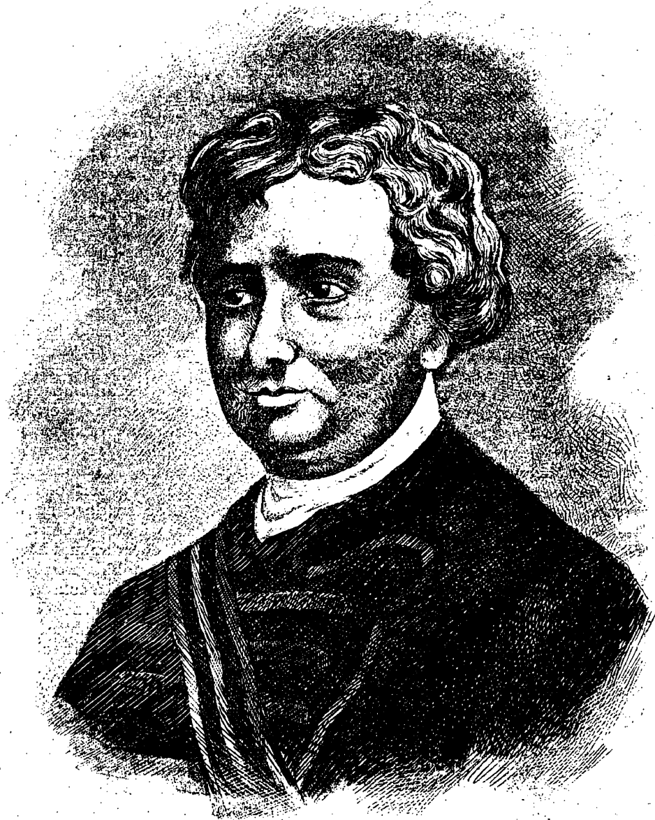
DON JUAN DE GARAY