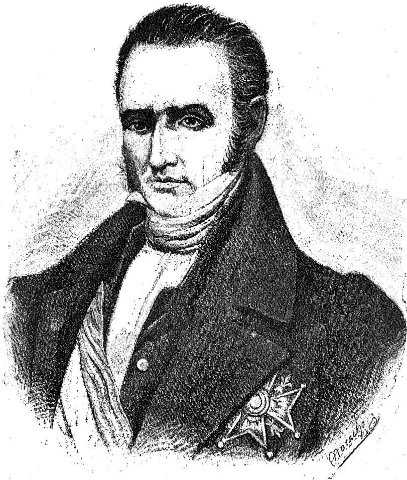
JUAN BAUTISTA DE ERRO