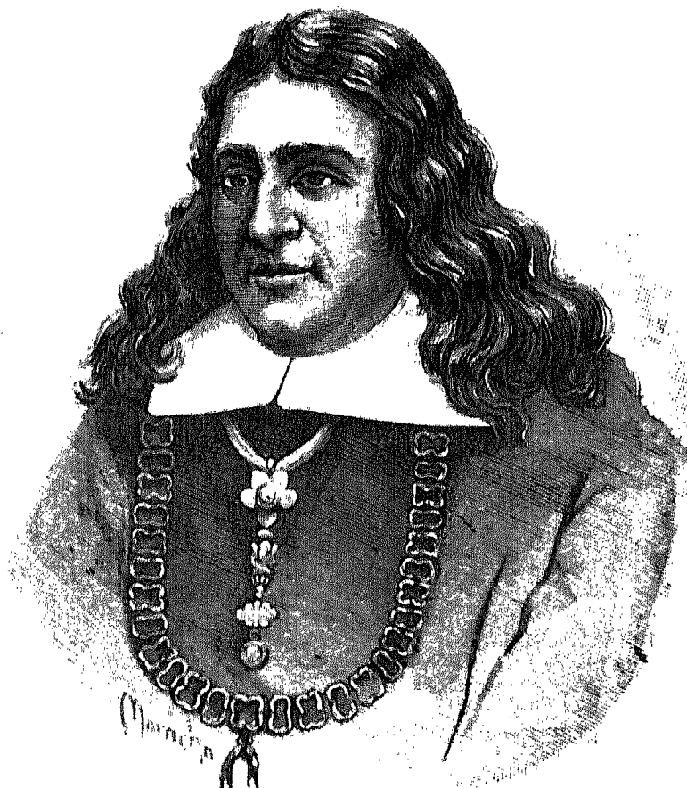
JOSÉ DE ARMENDARIZ