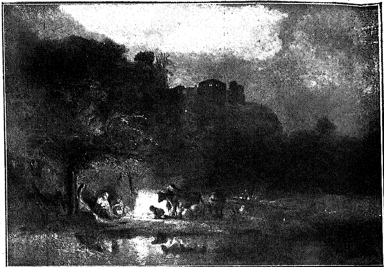
LA HUIDA A EGIPTO—Rembrandt Van Ryn