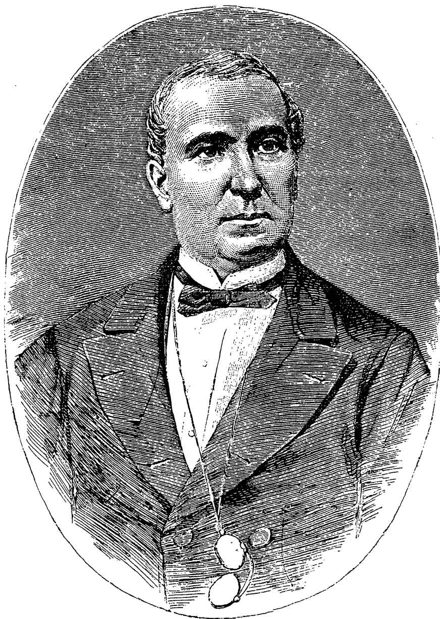
EXCMO. SEÑOR CONDE DE IBARRA