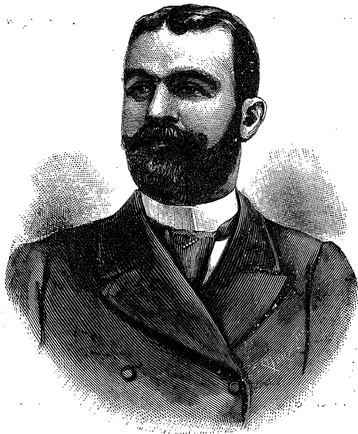
DOCTOR FÉLIX ARAMENDÍA Presidente honorario del Congreso médico de Roma