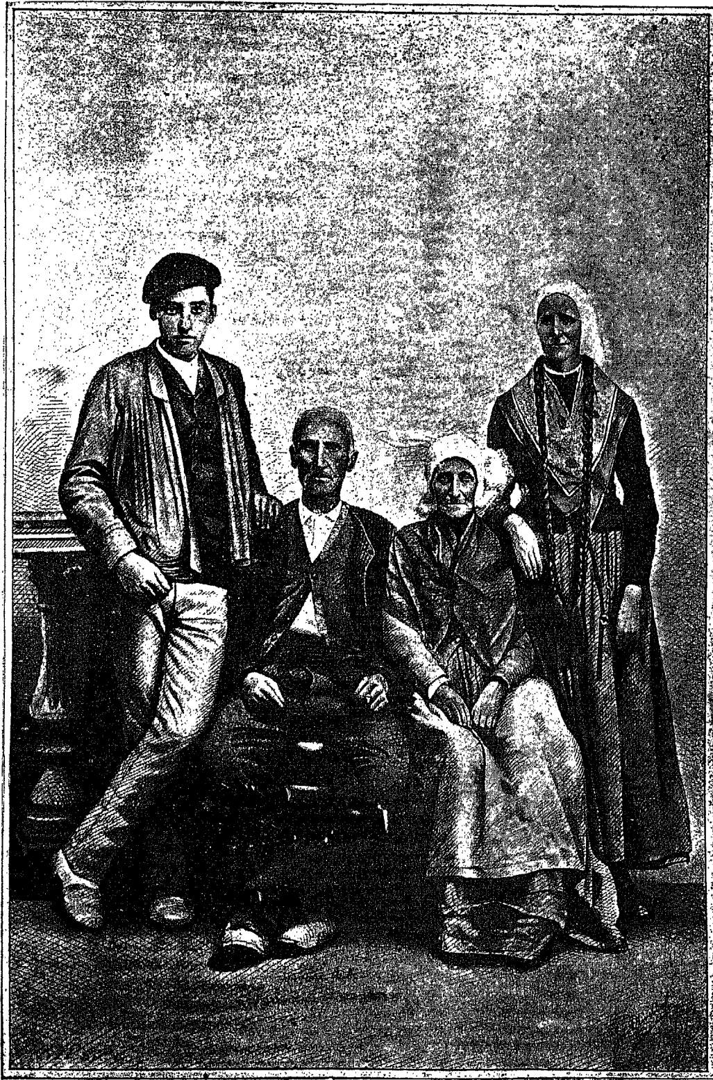
FAMILIA DE UN CASERIO VIZCAINO