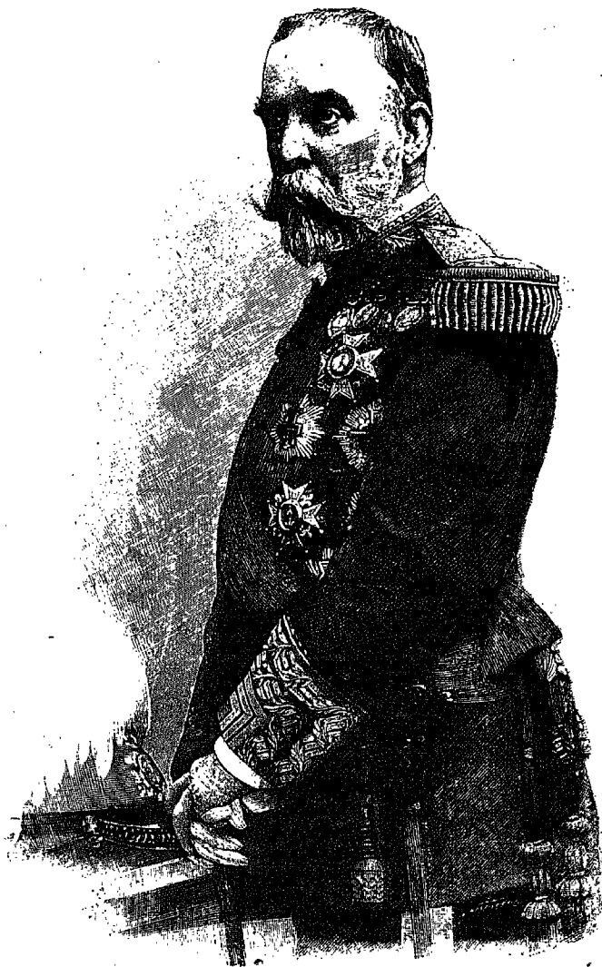
EXOMO SR. GENERAL BLANCO Y ERENAS