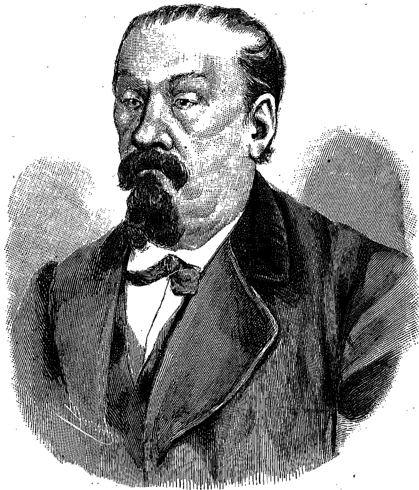
LESMES DE BAZTARRIOA