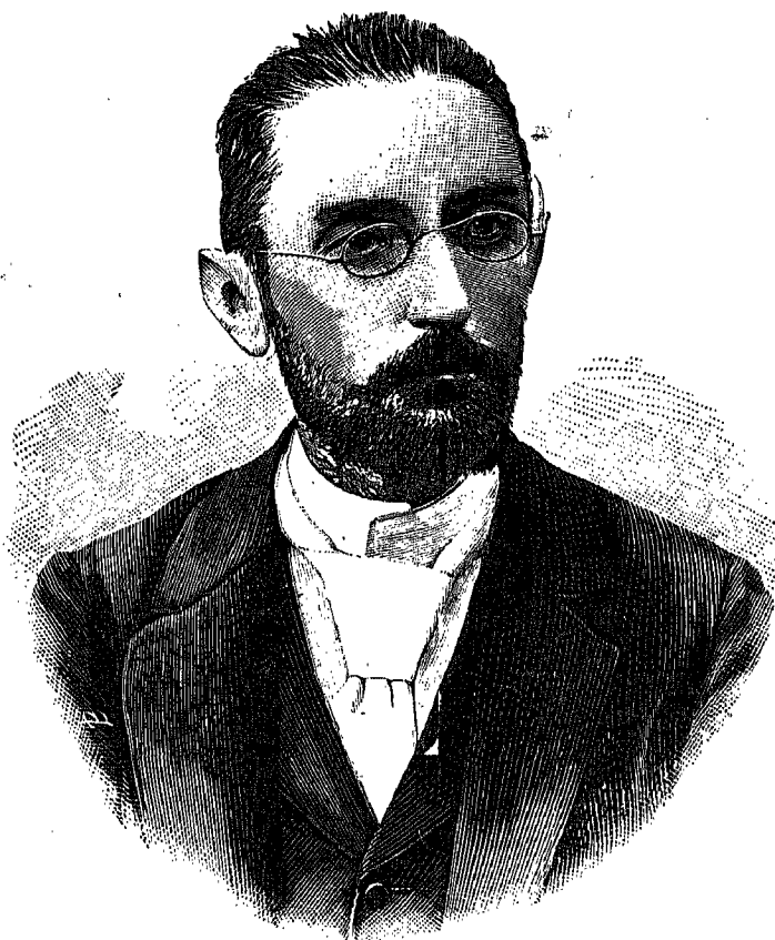
MIGUEL DE UNAMUNO