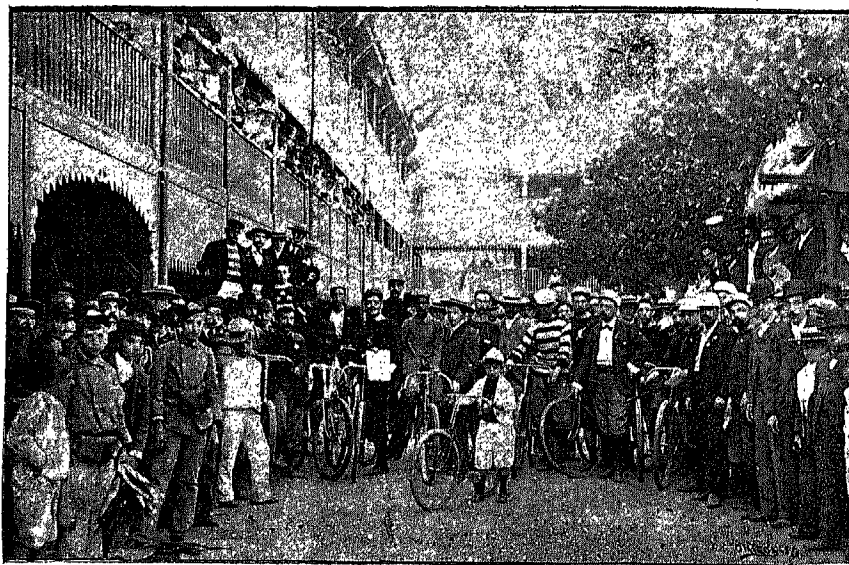
MOMENTO DE SALIDA