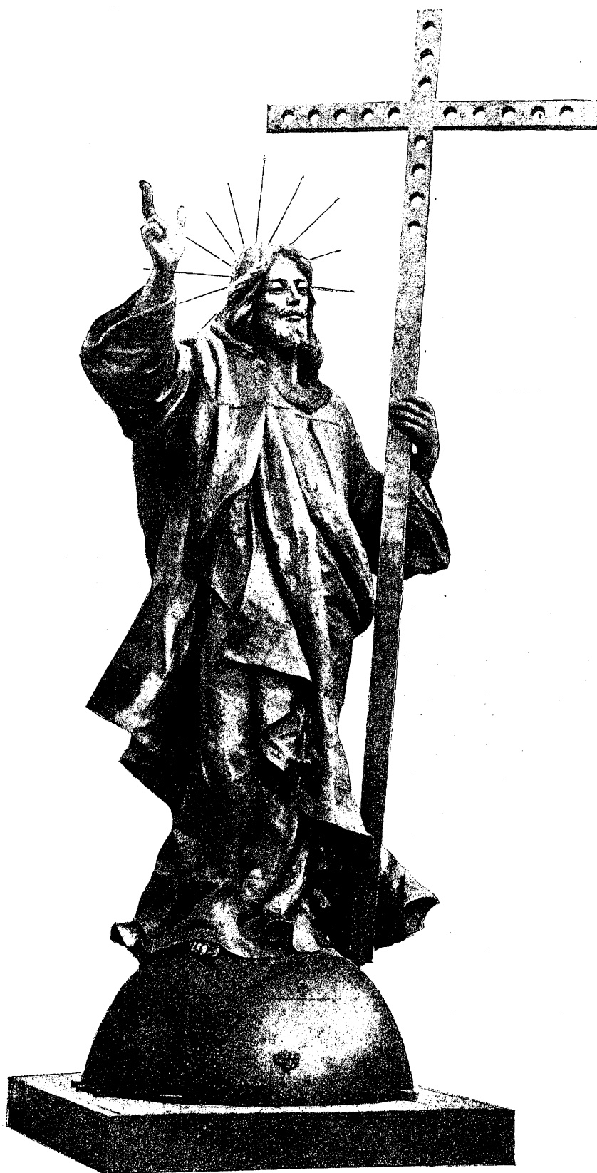
Emplazado en la línea de las altas cumbres que separa Chile de la Argentina

La República Argentina ha conmemorado el 12 del actual su efeméride histórica del paso de los Andes, haciendo latir los corazones de los que verdaderamente sienten el amor patrio, el más grande de los amores.