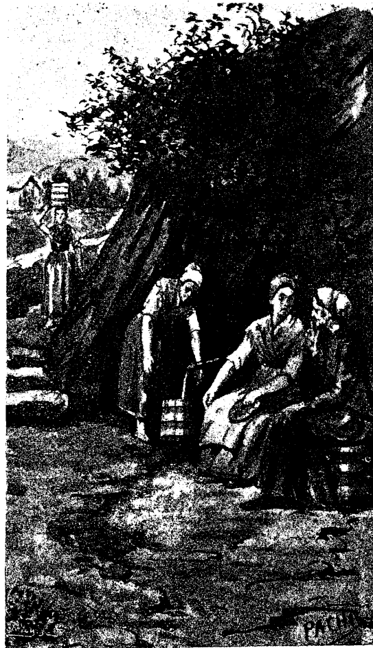
SECRETOS Á VOCES

El síncope reconoce causas muy diversas y las más frecuentes son: miedo, dolor, compresión de los vestidos, pérdidas sanguíneas, embriaguez, olor de ciertas flores, etc.