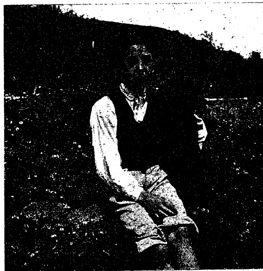
PENSANDO EN EL PORVENIR