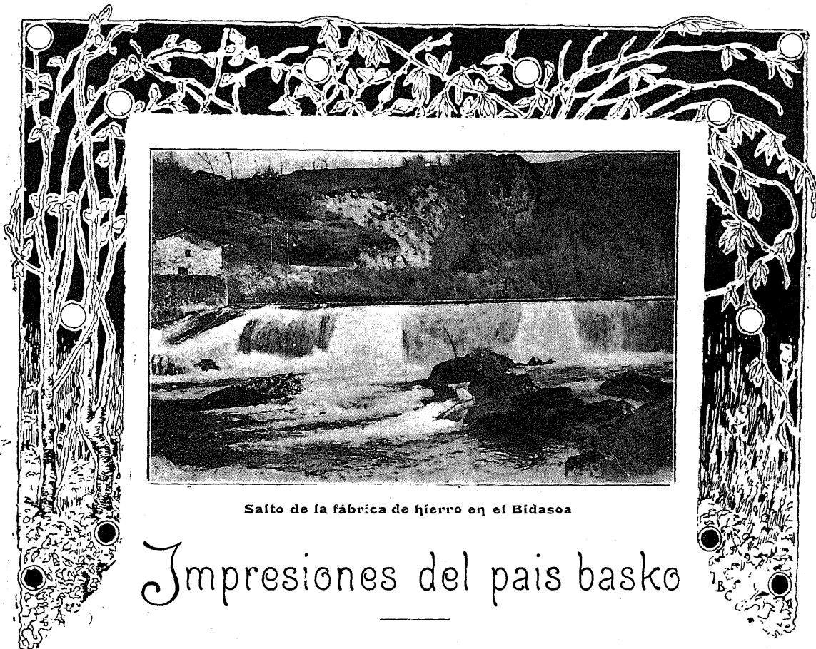
Salto de la fábrica de hierro en el Bidasoa