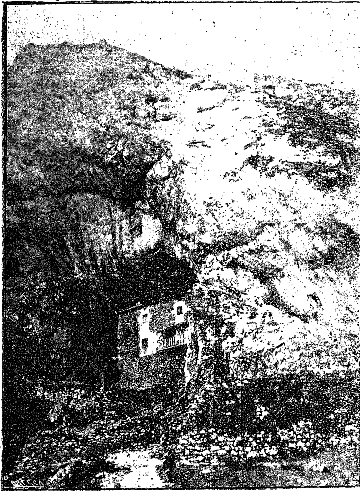
TÚNEL NATURAL DE SAN ADRIÁN (AITZGORRI)

Objeto de detenido estudio viene siendo, desde hace años, esta agreste región de Guipúzcoa, en que la naturaleza ofrece rarezas de difícil comprensión para los hombres afectos á escudriñar sus misterios.