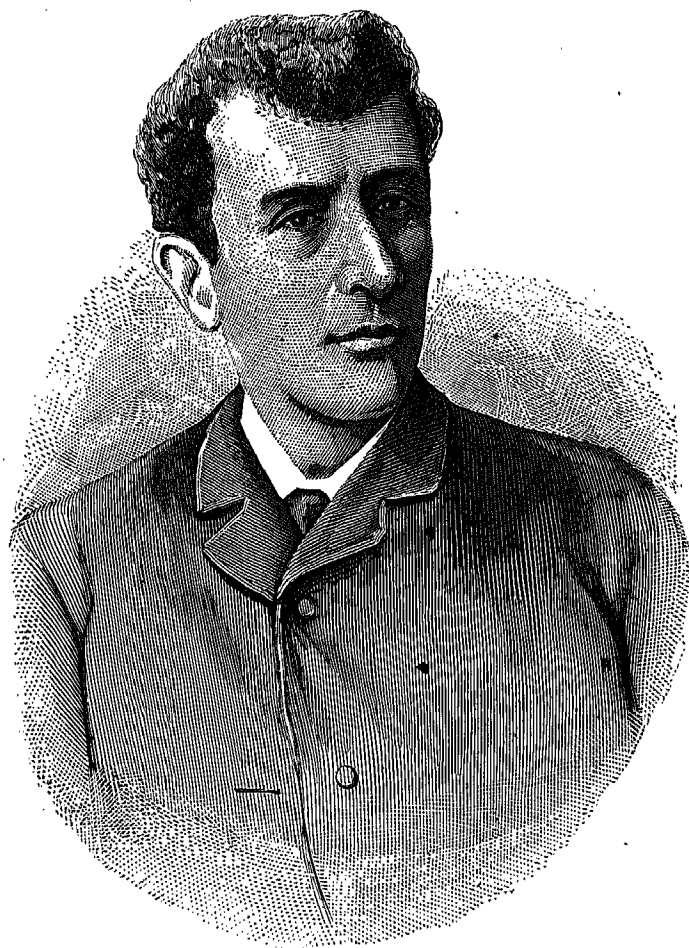
RICARDO DE ZAMACOIS