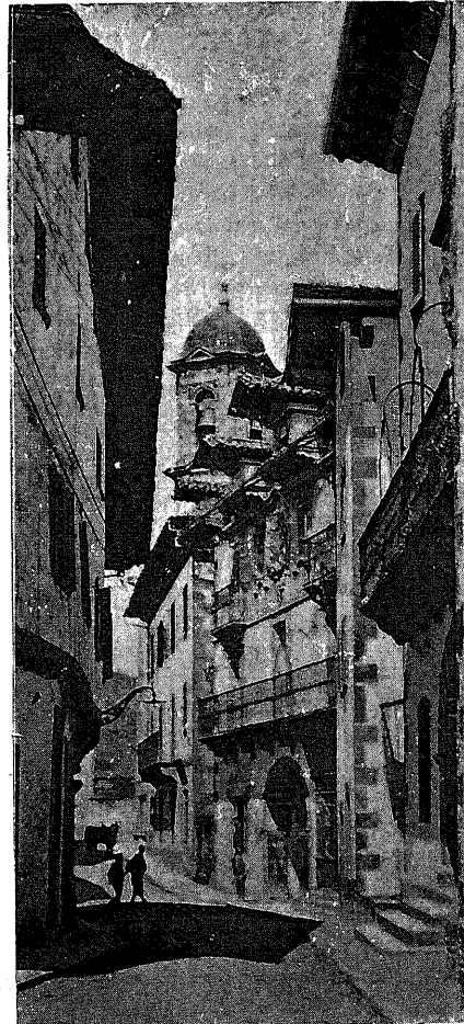
Una calle de Elizondo

En edades posteriores, el Baztán está inti-