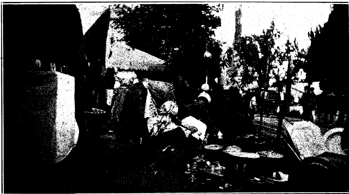
Preparando meriendas al comenzar la romería