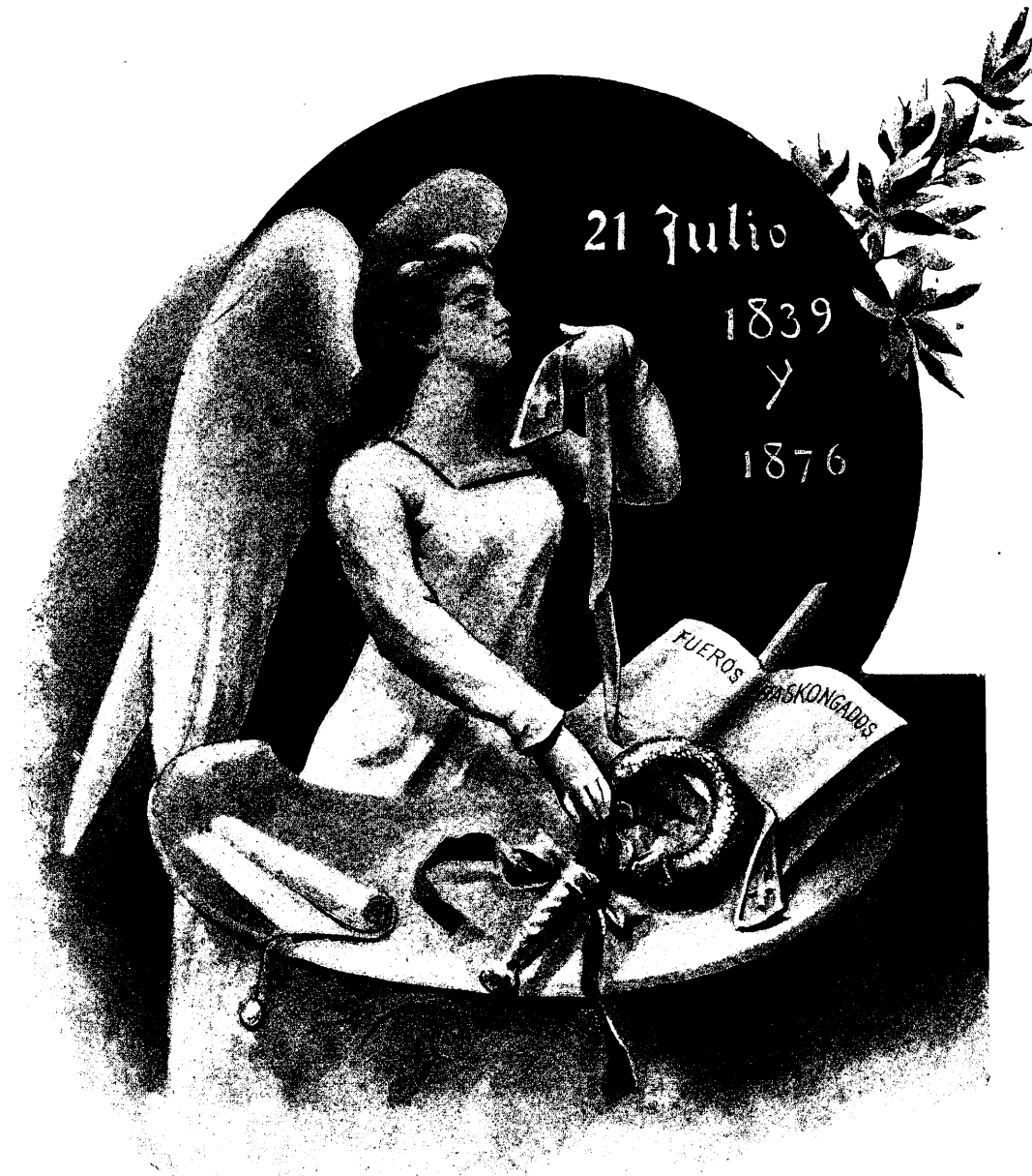
JURAMENTO DE FIDELIDAD